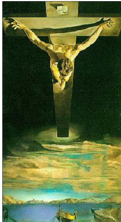
Il Cristo di San Giovanni della Croce - S. Dalí - 1951

Ich glaube an Gott als den allmächtigen Vater und an Jesus Christus, seinen eingeborenen Sohn, unseren Herrn, der aus dem Heiligen Geist und Maria der Jungfrau geboren ist, der unter Pontius Pilatus gekreuzigt und begraben, am dritten Tage auferstanden ist von den Toten, aufgefahren in den Himmel, sitzend zur Rechten des Vaters, von wo er kommen wird zu richten die Lebendigen und die Toten. Und an den Heiligen Geist, eine heilige Kirche, Vergebung der Sünden, Auferstehung des Fleisches. Amen.